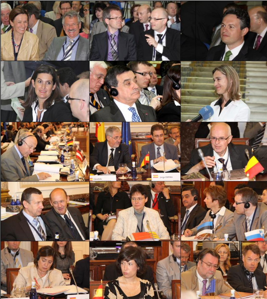
REUNION DE FISCALES GENERALES DE LA UNIÓN EUROPEA. Madrid, 20 de mayo de 2010

Y es en este punto, donde los Fiscales podemos aportar “experiencias y criterios que ayuden a mejorar, por la ley y desde la ley, la base jurídica para la convivencia que identificamos con el concepto de ciudadanía europea”, teniendo presente la necesaria unidad de actuación entre los Ministerios Públicos y los Tribunales Supremos y Cortes de Casación. “ Se trata en consecuencia de rentabilizar la sólida experiencia de esa tarea de tradición estatal centenaria, proyectando su utilidad hacia el espacio común”, apostilló Cándido Conde-Pumpido.