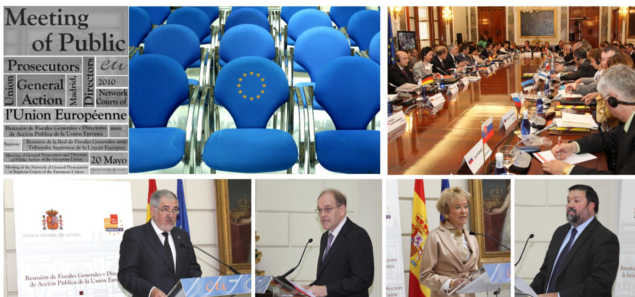
Intervenciones durante la Reunión de Fiscales Generales: Fiscal General de España, Cándido Conde-Pumpido, Presidente de Eurojust, Aled Williams, Vicepresidenta Primera del Gobierno, María Teresa Fernández de la Vega, y Ministro de Justicia, Francisco Caamaño.