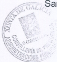
Alfonso Rueda Valenzuela

Santiago de Compostela, 15 de xuño de 2009