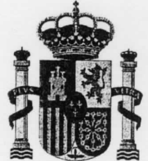
FISCALÍA GENERAL DEL ESTADO

información, de los formatos y de las aplicaciones que deberán ser tenidos en cuenta por las Administraciones Públicas para la toma de decisiones tecnológicas que garanticen la interoperabilidad.