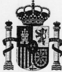
MINISTERIO DE JUSTICIA